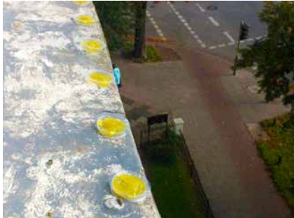
Für Passanten unsichtbarer Einsatz von Bird Free® auf einer Dachanlage

Es kann sowohl in Gebäuden als auch außerhalb angebracht werden.