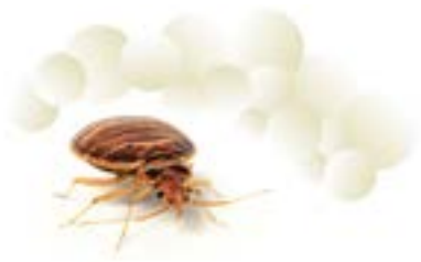
Die Plattwanze ( Cimex lectularius )

Die Platt- oder auch Bettwanze ( Cimex lectularius ) ist heutzutage ein weit verbreitetes Insekt und hat sich in den letzten Jahren zu einem ernstzunehmenden Problem für die Hotelindustrie und Tourismusbranche entwickelt.