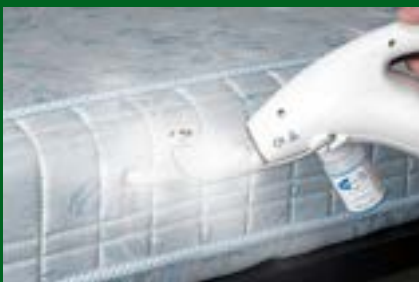
Die einfache Handhabung des CIMEX Trockendampf-Verfahrens im praktischen Einsatz.