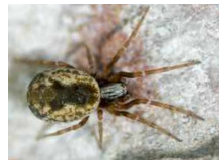
Mauerspinnne auf Hauswand.

Trotz des hohen ökologischen Nutzens ist es sehr ärgerlich, wenn ein Befall mit der Mauerspinnne zu unansehnlichen Flecken führt oder gar die Fassade beschädigt wird.