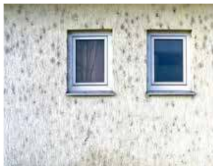
Von der Mauerspinne befallene und durch ihre Netze stark verschmutzte Hauswand.

Durch Abgase und Staub verfärben sich die Netze und verschmutzen als dunkle Flecken die Hauswand. Die unbrauchbaren Netze werden schließlich von der Mauerspinne durch neue ersetzt und die Verschmutzung setzt sich fort.