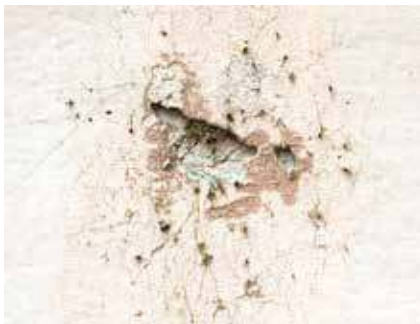
Netz der Mauerspinne an einer Hauswand.

Dort ist die Mauerspinne aufgrund ihrer geringen Größe mit dem bloßen Auge zwar kaum zu erkennen, dafür aber ihre handtellergrößen Netze, mit denen sie Insekten fängt.