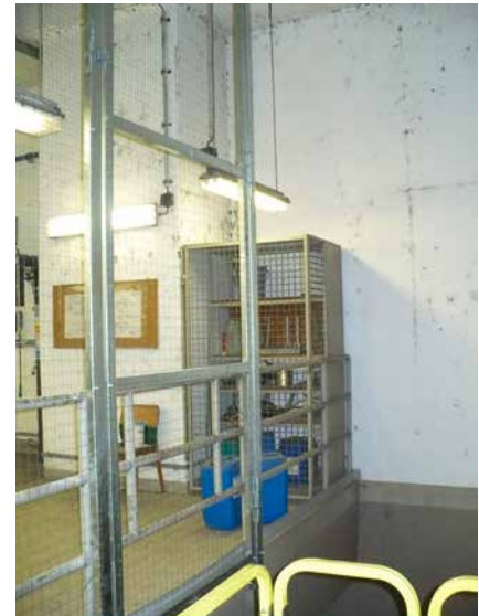
Vertikal angebrachtes Vernetzungssystem innerhalb einer Industrieanlage

Der Einsatz von senkrecht installierten Netzen empfiehlt sich besonders immer dann, wenn die Optik des Gebäudes möglichst nicht beeinträchtigt werden darf, unter anderen an historischen Gebäuden oder Denkmälern.