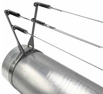
Spanndrahtsystem für Rohre

Das System ist schnell und unkompliziert auch auf unebenem Untergrund problemlos einsetzbar. Die Pins sind einzeln austauschbar.