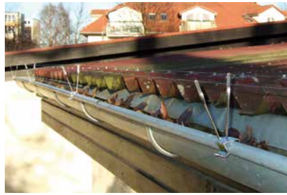
Professioneller Einsatz eines Spanndrahtsystems an einer Regenrinne

Spanndrahtsysteme stellen eine einfache und doch effektive Form der Taubenabwehr dar. Sie erfreuen sich besonders bei historischen Gebäuden großer Beliebtheit, da für die Abstandhalter gerade mal 2-mm-Bohrungen benötigt werden beziehungsweise je nach Untergrund auch geklebt oder genietet werden kann.