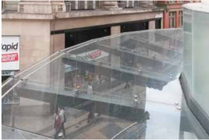
Extrem unauffällige Avishock-Installation auf einem Glasdach

Taubenvergrämung via Elektro- oder Impulsstromsystem erfolgt nach dem „Weidezaun-Prinzip“: Die Vögel werden bei Kontakt einem unangenehmen, jedoch harmlosen Stromimpuls ausgesetzt, welcher die Tiere ohne Gewöhnungseffekt vertreibt.