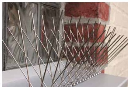
Auf Fensterbank installiertes Spike-System

Spanndrahtsysteme werden bevorzugt eingesetzt gegen Tauben am First, zum Schutz vor Vögeln an Rohren sowie zur Verhinderung des Absetzens von fliegenden Vögeln an Fensterbrettern und an Vorsprüngen.