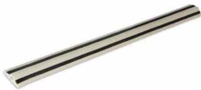
Avishock-Schienen in bewährter Qualität

Mit Avishock™ verwenden wir hierbei ein System der neuesten Generation, welches sich ideal an Ihre Bedürfnisse anpasst und zugleich allen Ansprüchen des Tierschutzes gerecht wird. Das installierte System ist nur 6 mm hoch und dadurch extrem unauffällig. Dank seiner hohen Flexibilität passt es sich annähernd jeder Oberflächenstruktur an. Es ist schnell zu installieren und zu einem hervorragenden Preis-Leistungs-Verhältnis erhältlich.