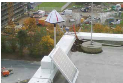
Solarbetriebenes Eagle Eye®. Keine Strominstallation erforderlich

Bei dem System handelt es sich um einen rotierenden Spiegel, welcher durch eine spezielle, neuartige Technik die Lichtstrahlen so reflektiert, dass diese die Gegenwart von Greifvögeln imitiert und so das Absitzen von fliegenden Vögeln unter dem Spiegel verhindert.