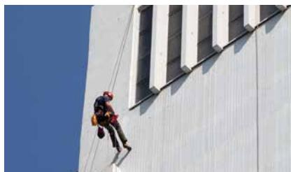
Industriekletterer bei der Installation von Taubenabwehrnetzen an einem 160 Meter hohen Turm.

Bei unvollständigen oder falsch durchgeführten Taubenabwehrmaßnahmen ist der Erfolg meist nur von kurzer Dauer, da die reviertreuen Tiere oftmals nur auf den nächsten zur Verfügung stehenden Platz ausweichen und in der Regel schon kurz darauf ein Rückfall zu beobachten ist.