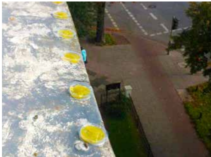
Für Passanten unsichtbarer Einsatz von Bird Free® auf einer Dachanlage

Es kann sowohl in Gebäuden als auch außerhalb angebracht werden.