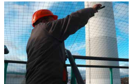
Horizontal ausgerichtete Vernetzungsarbeiten durch einen unserer Fachkräfte

Eine waagerechte Vernetzung wird empfohlen, wenn diverse Gebäudefunktionen, wie zum Beispiel die der Temperaturregulierung, nicht durch das Vogelabwehrsystem beeinträchtigt werden dürfen.