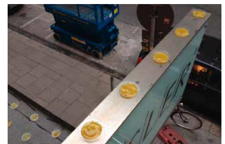
Blicksichere, dezente Anbringung von Bird Free® auf einer Leuchtreklame

Bird Free® „To Nature“ V2-Gel zielt nicht auf eine mechanische Barriere zur Vogelvergrämung ab, sondern bewirkt eine langfristige Veränderung der Lebensgewohnheiten.