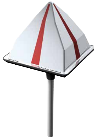
Eagle Eye® Taubenvergrämung mit innovativer Lichtreflexionstechnik

Auf diese Art lässt sich innerhalb von drei Monaten eine Reduzierung der unerwünschten Tiere um bis zu 80 Prozent erreichen.